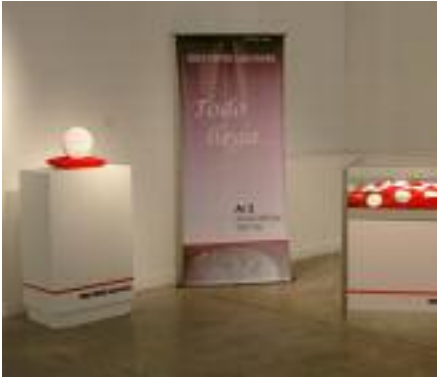
12 / 13 / 14