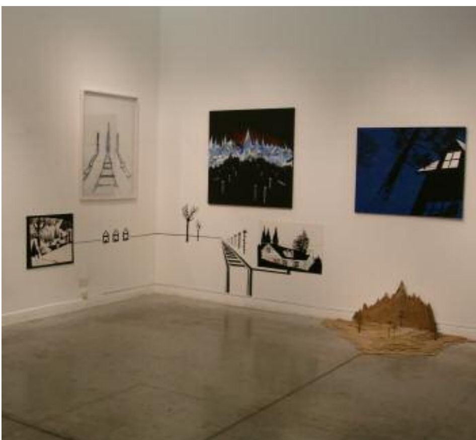
1 a 5