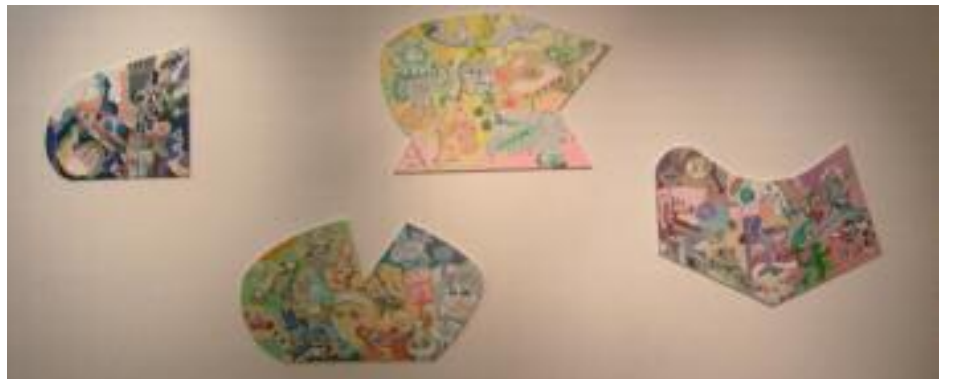
7 a 10